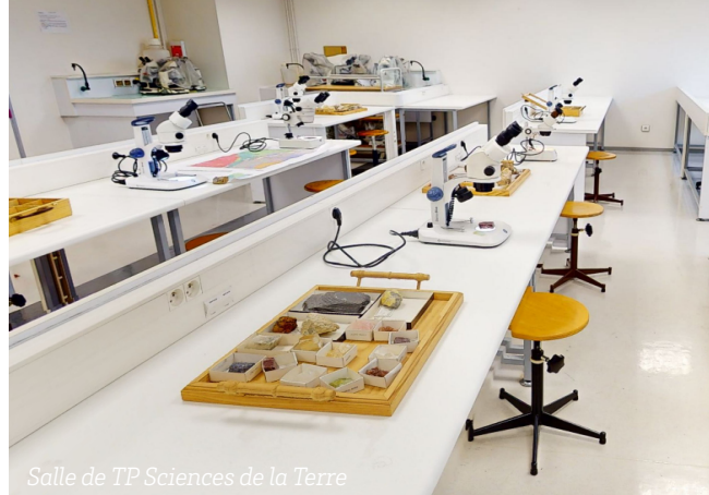
Salle de TP Sciences de la Terre

MNESS Mise à niveau pour les études supérieures scientifiques